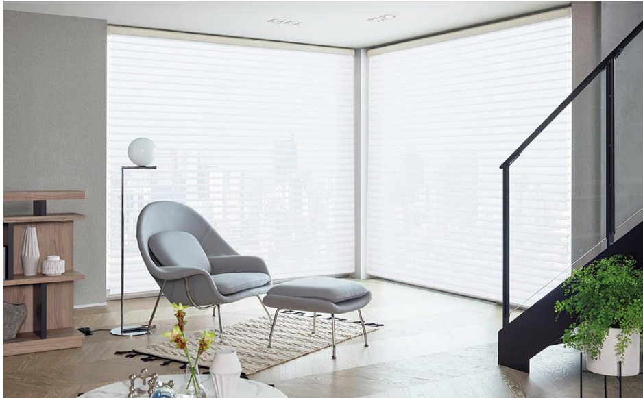
調光ロールスクリーン「ルミエ」ウェール(グレージュ)

立川ブラインド工業株式会社（本社：東京都港区三田、資本金：44億7,500万円、代表取締役社長：池崎久也）は、調光ロールスクリーン「ルミエ」の生地ラインナップを拡充し、2024年11月11日(月)より発売いたします。