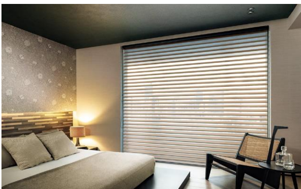
調光ロールスクリーン「ルミエ」ウェール遮光(コア)

調光ロールスクリーン「ルミエ」は、2枚のレースの間にドレープを配した立体構造で、採光と眺望をスマートにコントロールできる調光ロールスクリーンです。採光したときの美しい透過光が魅力で、プライバシーを守りながら、日射しをやわらげ、やさしい光をお部屋に採り入れることができます。電動製品「ホームタコス」にも対応しており、より快適な暮らしを実現します。