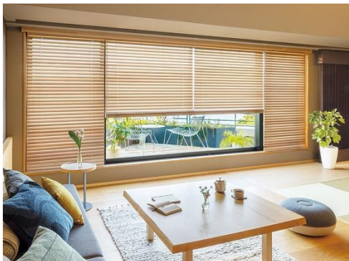
木製ブラインド「フォレティア」 スラット:スギ(無塗装品)

2024年5月のリニューアルに伴い、国内の環境保全に貢献できる国産のヒノキ・スギを使用したスラットや、安心安全な自然塗料のスラットなど環境に配慮したラインナップを新たに追加しました。また、電動化にも対応し、手動と同様のコンパクトな設計のホームタコスを発売。コンセントから電気供給する従来型の「電源コード仕様」に加え、本体にバッテリーを内蔵した「バッテリー仕様」を新発売しました。コンセントが近くなくてもホームタコスを設置することができ、さまざまなシーンにより快適な暮らしを実現します。