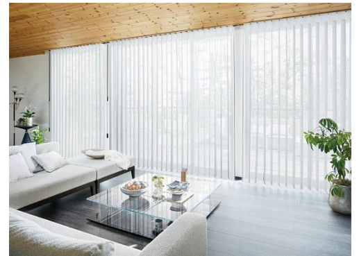
調光タテ型ブラインド「エアレ」 生地: フォルモ(グレー)

また、カーテンと異なり生地の間を自由に通り抜けることができ、お部屋の内と外をシームレスにつながります。お手入れについても、生地を1枚ずつ取り外して洗濯することができるため、長く快適にご使用いただける製品です。