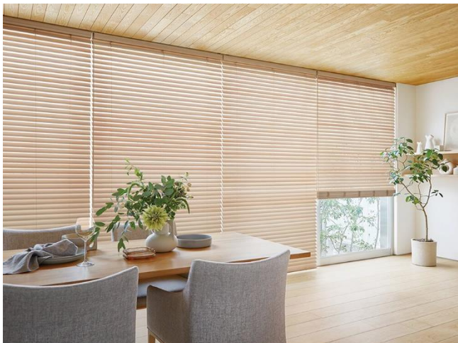
木製ブラインド「フォレティアエグゼ」 スラット:ヒノキ(無塗装品)