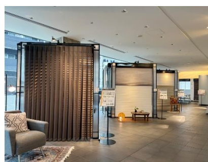
タチカワブラインド大阪ショールーム