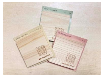
▲木製コースターイメージ

プレゼント内容 : 木製ブラインド「フォレティア」のデザイン入り『木製コースター』(桐・ヒノキ・スギ)の中からおひとつ