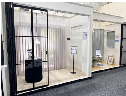
タチカワブラインド銀座ショールーム

タチカワブラインドのショールームでは、家具や小物を用いたインテリアコーディネート提案をはじめ、さまざまなスタイルの窓辺づくりやカラーコーディネートなど、窓まわりだけにとどまらないアイデアをご提供しています。5月下旬より、ご来館いただきアンケートにお答えいただいた皆さまに、リニューアルした木製ブラインド「フォレティア」の桐・ヒノキ・スギをイメージした木製コースターをおひとつプレゼントしています。さらに多くの方へ木製ブラインドの魅力をお届けたく、この度キャンペーン期間を延長することにいたしました。