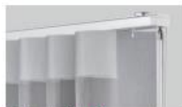
ライトグレー 新色