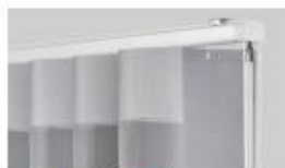
マットホワイト 新色

インテリアに馴染みやすいマットな質感のマットホワイト、ライトグレーを新たに追加。また、フローリングや家具とコーディネートしやすい木目調の「ウォームシリーズ」を新たにラインナップし、モダンインテリアから北欧テイストまで幅広いインテリアに調和し、お部屋の雰囲気を引き立てます。