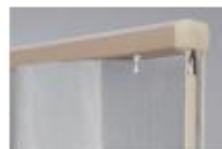
ナチュラルブラウン(木目調)