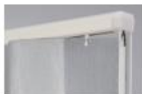
ファインホワイト(木目調)