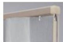
グレージュ(木目調)