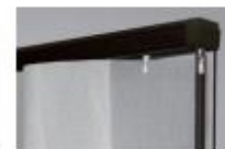
ダークブラウン(木目調)