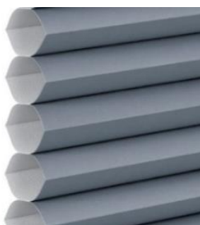
なめらかで上質な質感の「ストラル遮光」

「ストラル遮光」は、プライバシーをしっかりと確保する遮光1級を有する生地で、なめらかで上質な質感とトレンドに合わせたグレイッシュなカラーが特長。遮光生地として、従来からラインナップしている「メライト遮光」に「ストラル遮光」が加わり、質感や色で選びやすくなりました。プライバシーを守りたいリビングの窓や、寝室の窓におすすめです。