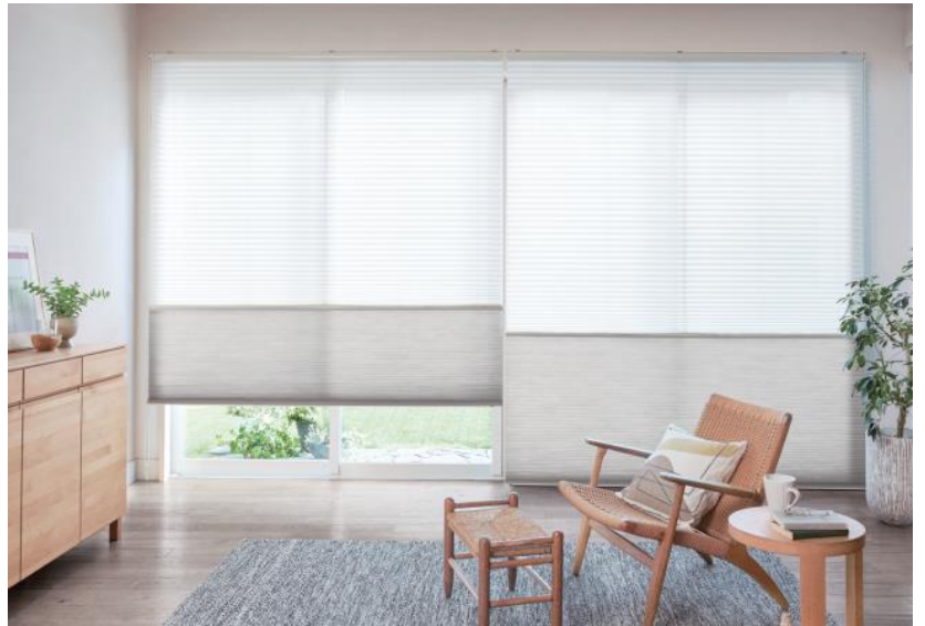
日射反射を高め、遮熱性能を高めたレース「ラジエ遮熱」