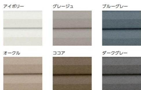
グレイッシュなカラーをラインナップ